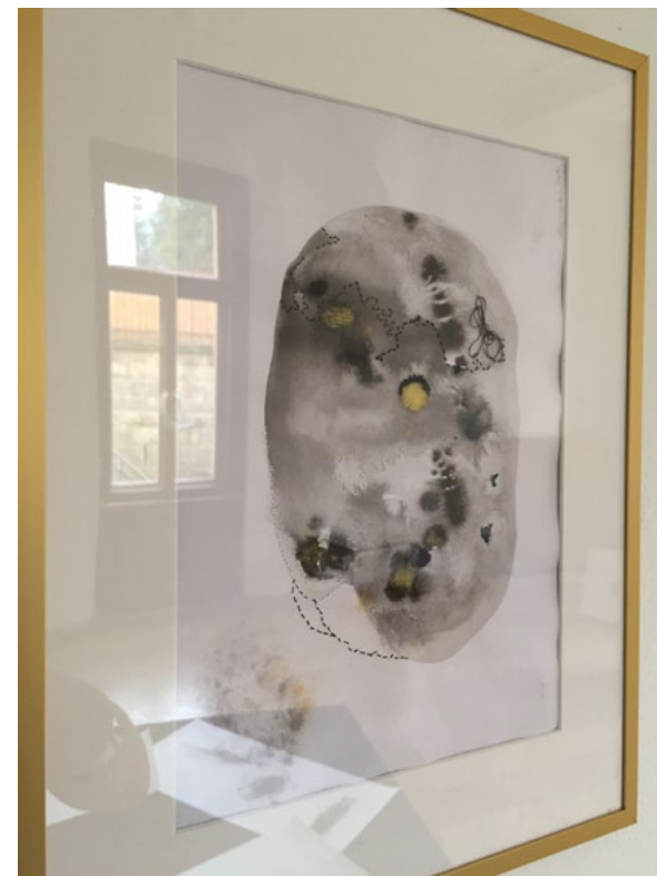
expozičia v 3. miestnosti Pistori Palác, 1. poschodie akvarel 2021