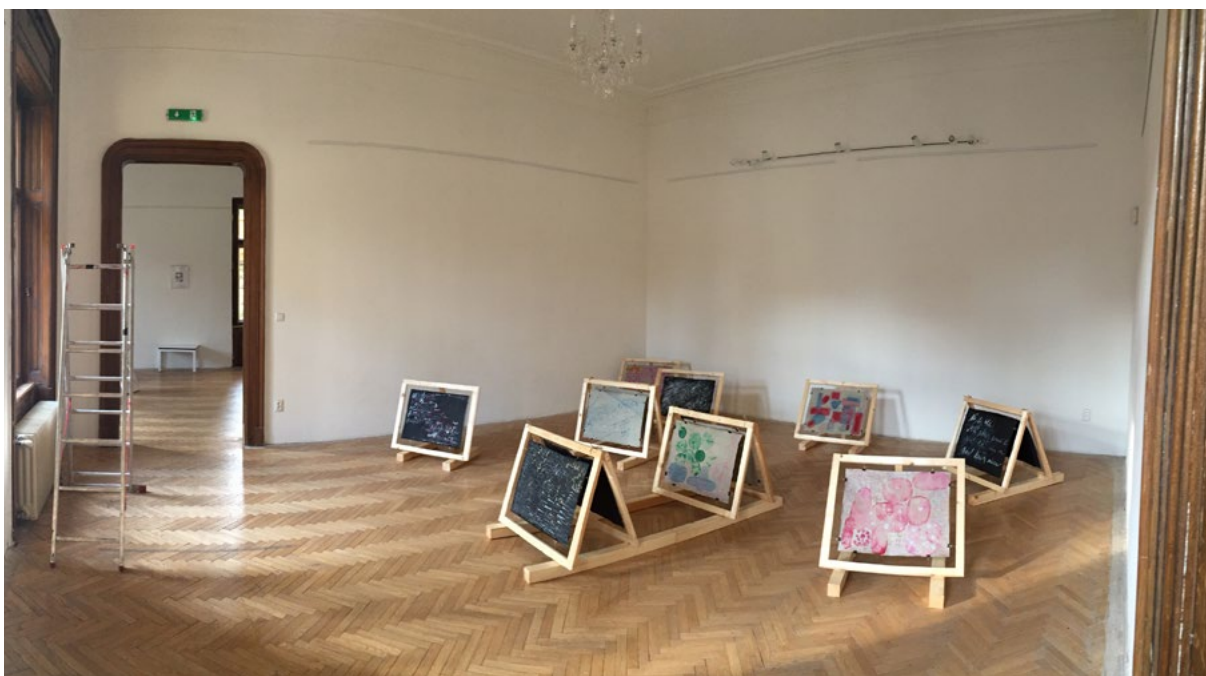
expozičia v 2. miestnosti Pistori Palác, 1. poschodie Kaligrafie na japonskom ručnom papieri v priestore galérie 2021