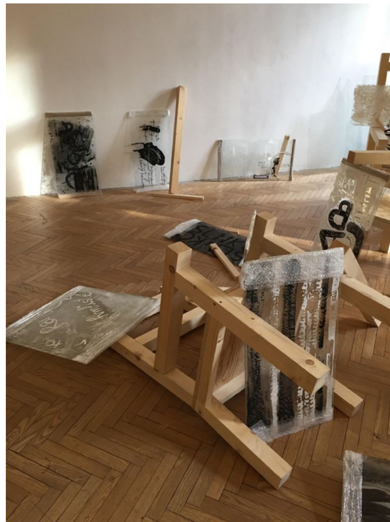
expozícia v 1. miestnosti Pistori Palác, 1. poschodie Inštalácia v priestore galérie 2021